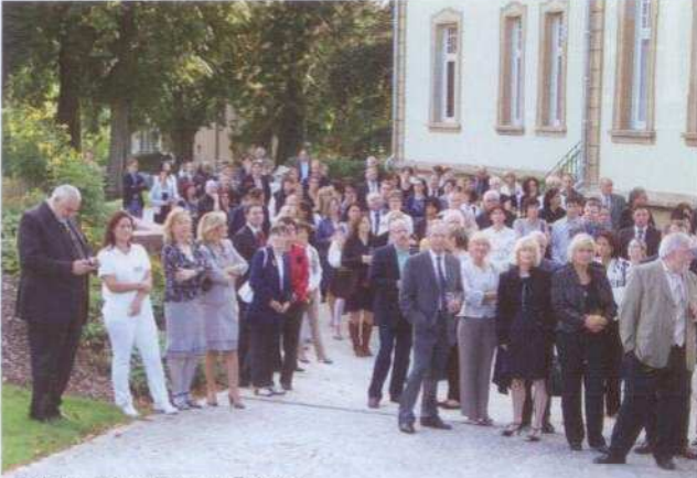
Teil der aufmerksamen Zuhörer