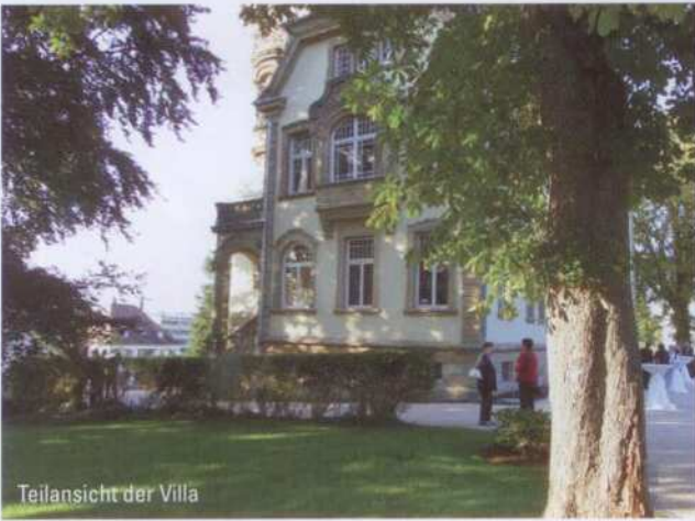
Teilansicht der Villa